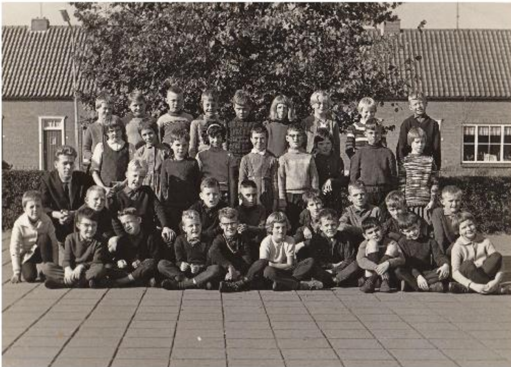
Schoolfoto klas 5 en 6, schooljaar 1966-1967.