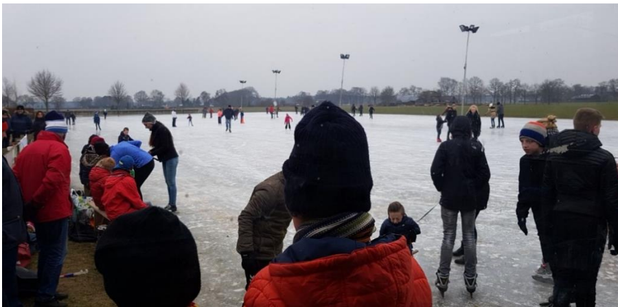
Gezellige drukte op de IJsbaan “de Bonekamp” in Wesepe

Ook uw bijdrage als lid-donateur was van harte welkom. Wij hebben hiervan onder andere een aantal rekjes gekocht om achter te schaatsen: dit was een goede investering aan het vele gebruik te zien!