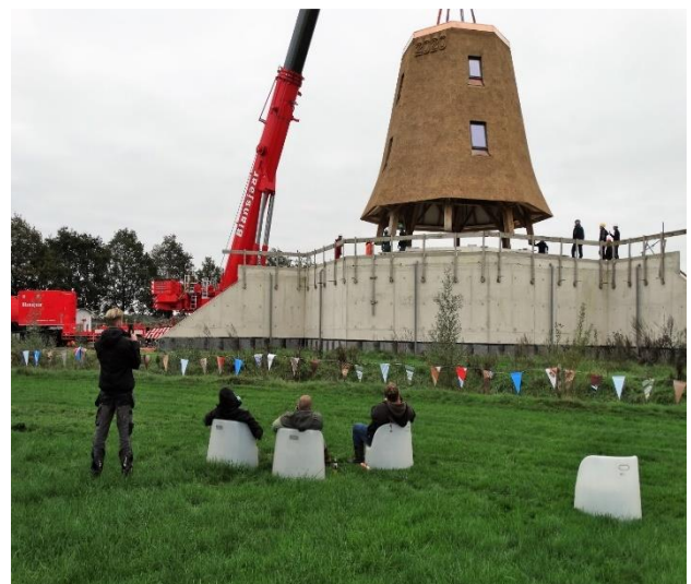
Plaatsing nieuwe molen Wesepe