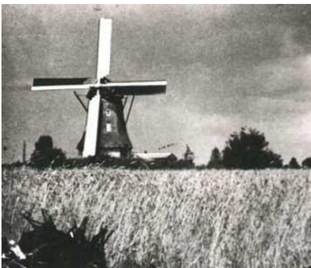
Oude molen Wesepe

Tot slot, eerste paasdag op het NOS-Journaal en op Teletekst: Molenwieken in Nederland toch nog een grote inhaalslag aan vervanging en reparatie in de komende jaren en dat was ook een item bij van Vaags & Groot Wesseldijk, dezelfde zaken die wij een dag ervoor met eigen ogen hebben kunnen aanschouwen. Hoe toevallig!!! Wij kunnen niet wachten tot de molen gaat draaien in Wesepe! Een aanwinst voor ons prachtige dorp!!!