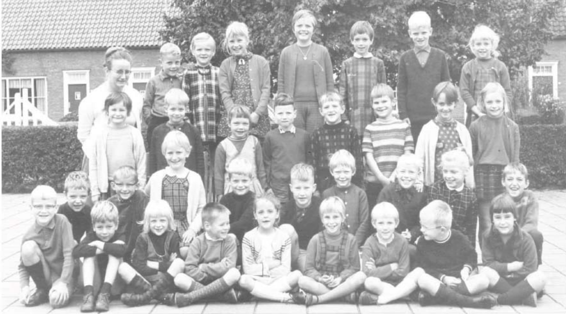
Schooljaar 1968/1969 A.Boschool 1e en 2e klas.