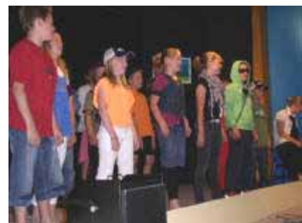
Afscheidsmusical gr. 8

Nu de schoolreizen, het pannenkoekenfeest en de afscheidsmusical geweest zijn zit dit schooljaar er echt op. Foto's van de activiteiten zijn te vinden op de website van de school. Alle kinderen die uitvliegen naar de middelbare school wensen wij veel plezier en succes op hun nieuwe school. Alle andere kinderen zien wij maandag 11 augustus weer terug op school.